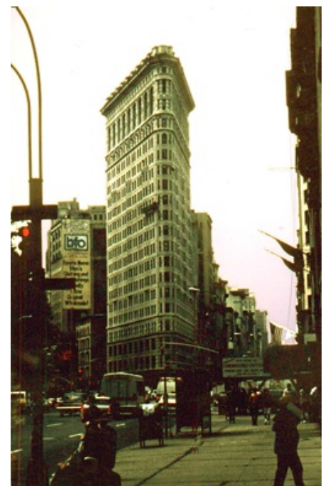
Nueva York (Estados Unidos).

Al igual que ha ocurrido en Europa, el centro urbano de la ciudad va viendo desplazado su uso residencial a favor de la función financiera y de servicios en general.