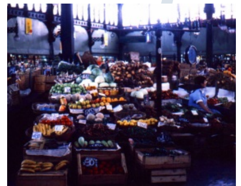
Mercado en Santiago (Chile)

Entendida como abastecimiento y suministro a la población que reside en la ciudad. La demanda de la población de las grandes urbes hace que la forma y la distribución del comercio se diversifique y surjan nuevas modalidades de comercio que afectan directamente al paisaje urbano. El elevado precio del suelo urbano y la búsqueda de estacionamiento para los usuarios hace que los hipermercados o grandes superficies comerciales se sitúen a las afueras de la ciudad, aunque en lugares bien comunicados con el centro. Por otra parte, las tiendas especializadas en productos concretos y de mayor valor, se suelen colocar en lugares céntricos de la ciudad y que resultan accesibles mediante el transporte público.