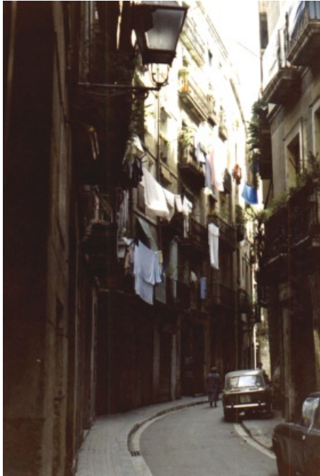
La "ciutat vella" de Barcelona, viviendas en el centro de la ciudad.