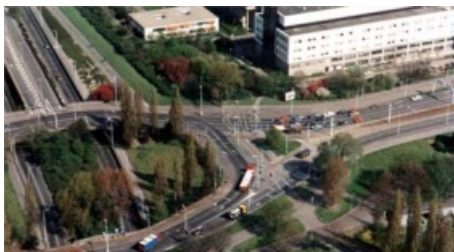
Nudo de comunicaciones en Rotterdam. (Países Bajos).

El otro aspecto es el transporte en el interior de la ciudad, problema de difícil solución, sobre todo en las ciudades europeas donde el trazado viario es estrecho y la remodelación urbanística resulta compleja o incluso imposible. Proporcionar un transporte público que sea rápido y económico y que permita la reducción de los problemas ligados a esta actividad (contaminación, congestión y estacionamiento) es uno de los grandes retos que se plantean a las grandes ciudades en este momento.