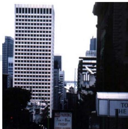
El centro administrativo y financiero de San Francisco (Estados Unidos)

Se trata de una actividad imprescindible en cualquier ciudad, ya sea capital de provincia o de una nación. La superficie destinada a esta función estará en relación a la categoría de la ciudad y a sus necesidades.