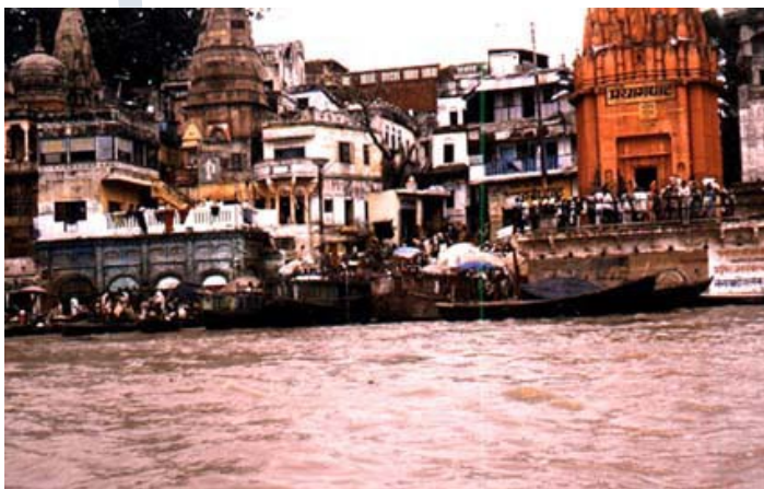
Función religiosa: la ciudad de Benarés (India) situada a orillas del río sagrado Ganges, atrae a miles de peregrinos para bañarse en sus aguas.

papel político y administrativo; Benarés, Fátima, Lourdes o Santiago de Compostela deben su fundación a un motivo esencialmente religioso. No obstante, la mayoría de las ciudades deben su origen bien a una actividad comercial ligada a los me-