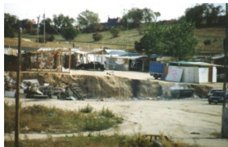
Chabolas en la periferia de la ciudad de Madrid.

La distribución de las viviendas formando barrios viene definida por distintos factores, de los cuales el más evidente es el del precio del suelo. Los ensanches que surgen en el siglo XIX en las ciudades industriales europeas albergan a una burguesía que se enriquece de forma progresiva. Más adelante surgirán barrios residenciales en la periferia de la ciudad y en torno a las vías de comunicación que facilitan el acceso a la ciudad central. Paralelamente, el centro de la ciudad es ocupado como residencia de las clases más desfavorecidas. También en las zonas periféricas surgen infraviviendas y chabolas que albergan a inmigrantes y población con escaso poder adquisitivo.