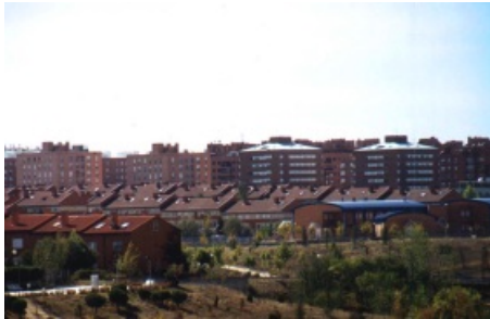
Función residencial: pisos y chalets adosados forman el paisaje urbano de la ciudad de Tres Cantos (Madrid)

Podemos definir las funciones de la ciudad como las diferentes actividades que se llevan a cabo en ella.