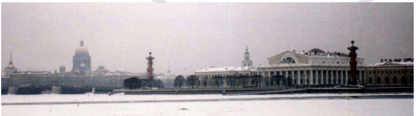
Función administrativa: San Petersburgo (Rusia), ciudad fundada por Pedro I el Grande, ofrece una vista de palacios y edificios burocráticos.

Algunas de las funciones más significativas de la ciudad son la residencial, la industrial, la administrativa, la comercial y otras funciones, como religiosa, cultural, educativa, etcétera.