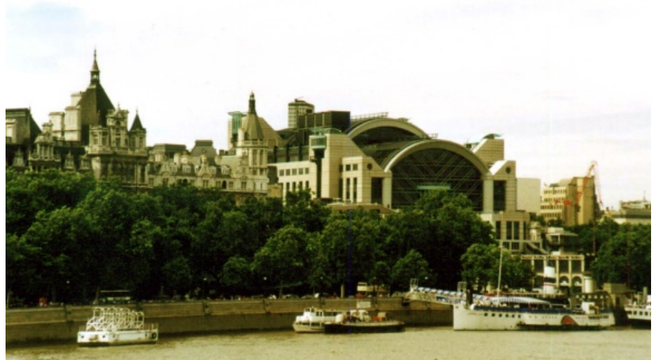
Londres, barcos en el Támesis.

Por otra parte, la accesibilidad a las ciudades, ya sea con transporte marítimo, ferroviario, por carretera o aéreo permite el desarrollo de las mismas facilitando la diversificación de sus funciones e intensificando su actividad económica.