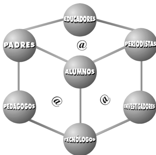
Fig. 1. Intercomunidad cibereducativa no formal creada en torno al Seminario Virtual

Medios de comunicación, facultades y departamentos universitarios, centros de educación formal y no formal, asociaciones y fundaciones, administraciones públicas nacionales e internacionales, padres, alumnos y usuarios anónimos de la red Internet reciben por diversas vías invitaciones periódicas a colaborar en el Seminario Virtual. Su participación está haciendo posible la creación de un cibertejido comunicacional interformativo de naturaleza interdisciplinar cuyas contribuciones van enriqueciendo progresivamente en variedad, calidad y cantidad la información disponible en sus bibliotecas virtuales.