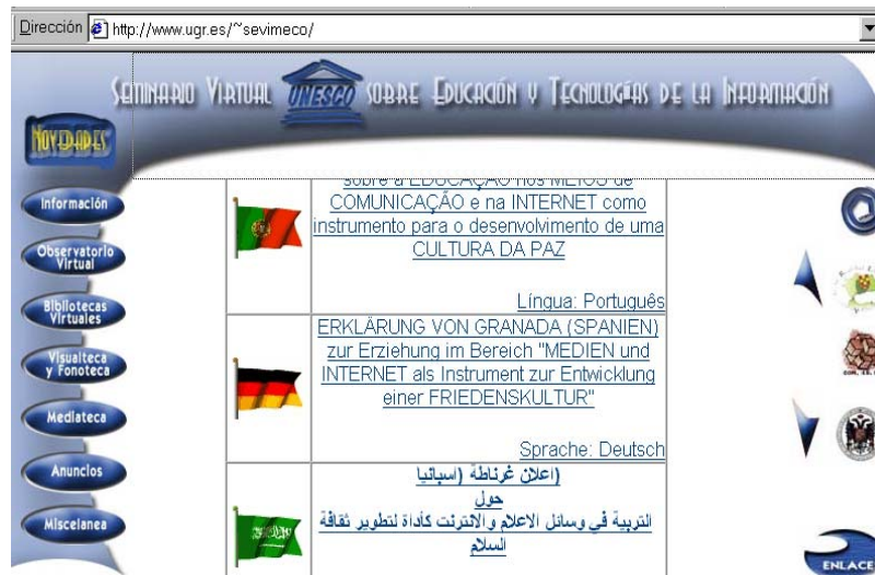
Figura 8. Subpágina del Seminario que contiene la Declaración de Granada en varios idiomas.