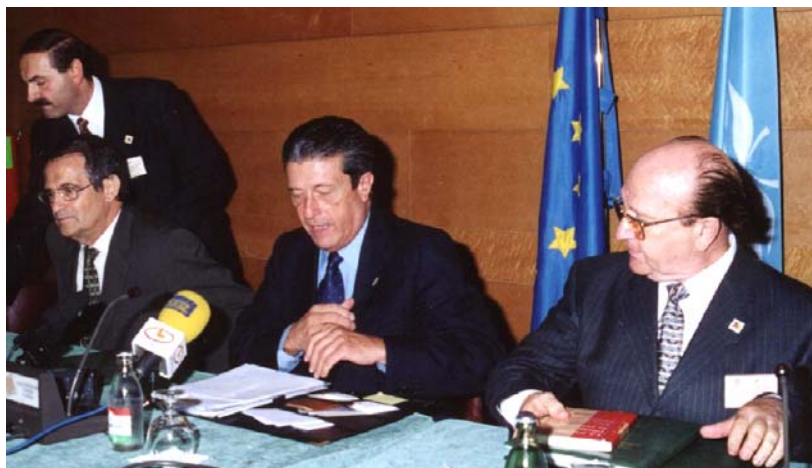
Figura.7. Federico Mayor Zaragoza en el momento de firmar la Declaración de Granada.

El congreso ha finalizado con la firma solemne por parte de trescientos expertos y representantes de medios de comunicación, instituciones y administraciones públicas de la Declaración de Granada sobre la EDUCACIÓN en MEDIOS de COMUNICACIÓN e INTERNET como instrumento para el desarrollo de una CULTURA DE PAZ .