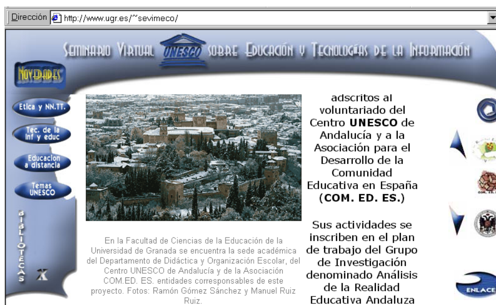
Fig. 4. Subpágina que muestra el índice de bibliotecas virtuales. En el centro de la pantalla puede leerse el texto de bienvenida con una imagen de la Alhambra de Granada.

La biblioteca de Temas UNESCO contiene documentos generados por la propia organización relacionados con los objetivos del Seminario.