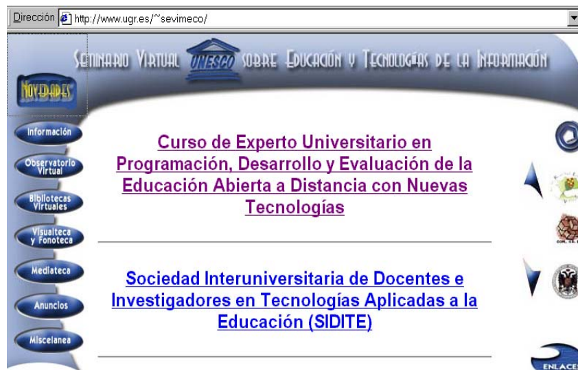
Figura 2. En la sección novedades se anuncia ahora la celebración de un curso de posgrado a distancia así como un Congreso presencial sobre "Ética en los contenidos de los MCS e Internet".

El apoyo internacional y la cobertura técnica ofrecida, desde sus inicios, por la Dirección General y por las Jefaturas de las Divisiones de Comunicación y Educación de la UNESCO están siendo de gran importancia para el desarrollo inicial del proyecto, uno de cuyos objetivos es difundir los ideales de la citada organización y los informes, estudios y publicaciones de este prestigioso Instituto especializado de las Naciones Unidas.