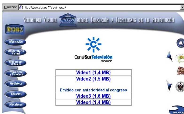
Fig. 6. Mediateca virtual en la que se han insertado vídeos que recogen noticias del congreso emitidas por una cadena de televisión.

La presencia de periodistas en los paneles de expertos del congreso ha sido muy relevante. Una treintena de profesionales de la prensa, la televisión y la radio, de profesores de diversas Facultades de Periodismo de España y directivos de Asociaciones de la Prensa han aportado los puntos de vista de sus respectivos Medios en la construcción de la Cultura de la Paz.